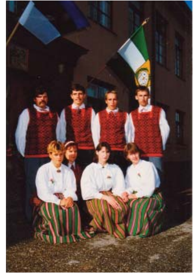
August 1998.

esialgu veel Urvastes, kuid seoses tantsijate ridade täienemisega Antslast, hakkasime koos käima Uue-Antsla rahvamajas, kus tegutseme praegugi. Tore on tõdeda, et meie koosseisus on kaks ema, kes on tantsupisikuga nakatanud ka oma lapsed ning tantsitakse rõõmsalt koos. Kõigile sobivat prooviaega on endiselt raske leida, kuid anname oma parima.