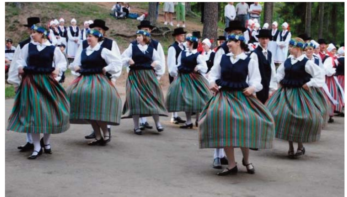
Kihelkonnapidu 2010.

20 tegutsemisaasta jooksul oleme üle elanud tõuse ja mõõnu. Meie ridadest on läbi käinud palju noori, kes õpingute, töö või isikliku elu muutuste tõttu ei ole saanud enam rühmas tantsida. Oleme tundnud suurt rõõmu kordaläinud esinemistest ning kannatanud jäädava lahkumise valu. Oleme saanud väga erinevaid esinemiskogemusi paksus liivas, märjal muruplatsil, tihedas vihmas asfaldil ja libedal lumel külmas pakases. Oleme esinenud kultuuriüritustel vallas, kihelkonnas ja maakonnas. Oleme aidanud püstitada „Sabatantsu“ rekordit Võru folkloorifestivalil 2000. aastal, proovinud läbida üldtantsupeo tihedat konkursisõela 2009. aastal, viinud edasi Teatetantsu katkematu rida 2011. aastal. Esinemised on viinud meid Põlvasse, Sangastesse, Pühajärvele, Kanepi külje alla Jägara külla. Kaugeim esinemine oli Talvisel tantsupeol Viljandis 2011. a