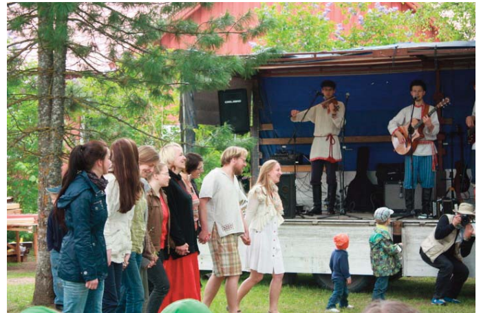
Urbanipäeva laada peaesineja ansambel Zetod esinemas laadalaval.