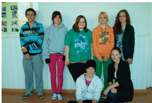
Urvaste valla esindus noorteseminaril

Kolme päeva jooksul said noored tutvuda teiste organisatsioonide noortega, osaleda erinevates õpitubades, püstitada küsimusi, mis tekitavad neile muret, samuti leiti neile ka ühise arutluse käigus lahendusi ning vastuseid. Võeti osa nii mitmestki põnevast vestlusest, mida juhtisid väga huvitavad ja omapärased inimesed. Lauldi, tantsiti, mängiti erinevaid seltskonna- ja